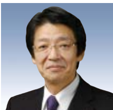
代表執行役副社長

1982年 4月 当社入社 2004年 4月 野村証券(株)執行役 2008年10月 当社執行役(兼 野村証券(株)執行役員) 2010年 6月 当社常務(執行役員)(兼 野村証券(株)常務(執行役員)) 2012年 4月 野村証券(株)常務(執行役員) 2012年 6月 同社代表執行役兼常務(執行役員) 2013年 4月 当社執行役コーポレート統括(兼 野村証券(株)執行役兼専務(執行役員)) 2016年 4月 当社執行役コーポレート統括(兼 野村証券(株)代表執行役副社長) 2017年 4月 当社代表執行役副社長コーポレート統括(兼 野村証券(株)取締役) 2018年 4月 当社代表執行役副社長(兼 野村証券(株)取締役)(現任)