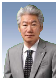
取締役 兼 代表執行役社長 グループCEO