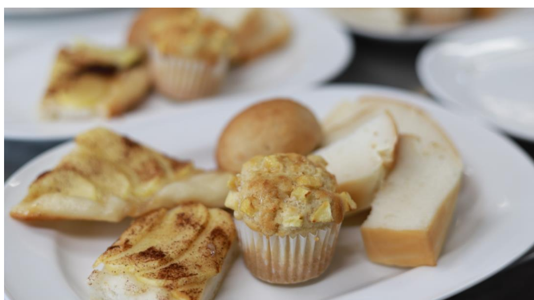
産品開発イベント：紫波産のお米を使用した生米パンの試食会

体験会では、2023年8月開催の第2回紫波町ファンミーティングで生まれたアイデアを具現化する形で、産品開発イベントや紫波町独自の自然の魅力発掘イベント等を開催しました。イベントの事後アンケートでは参加者全員が「紫波町に関わっていききたい気持ちが高まった」と回答しており、会員権体験に対する満足度やまちづくりへの参加意欲の高まりが確認できました。