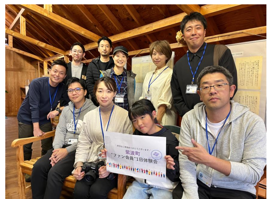
実証実験の参加者