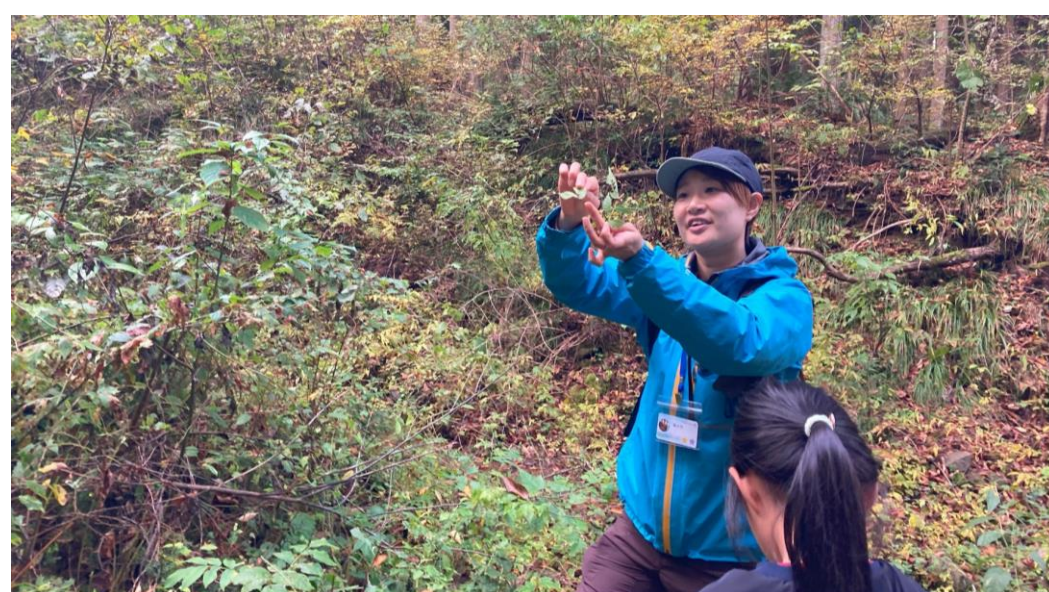
魅力発掘イベント：市民インストラクターによる森林ツアー