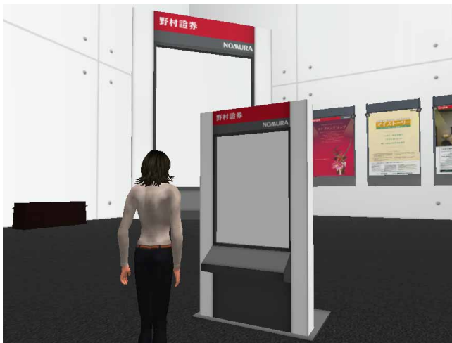
【店内(タッチパネル)】