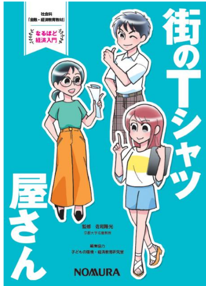
街のTシャツ屋さん