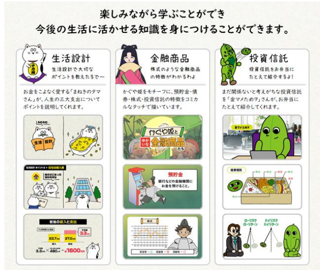
金融の専門家が教える人生を輝かせるお金のリテラシー