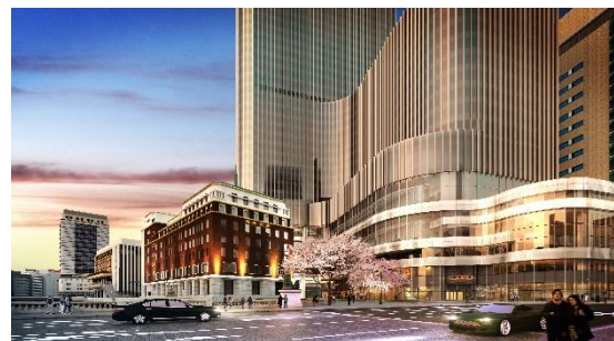
中央通り側からの低層部外観イメージ(夕景)