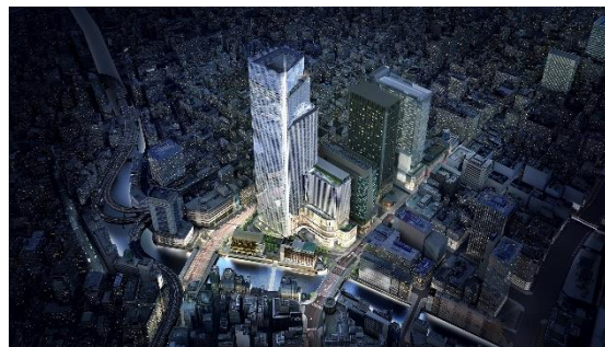
鳥瞰イメージ(夜景)